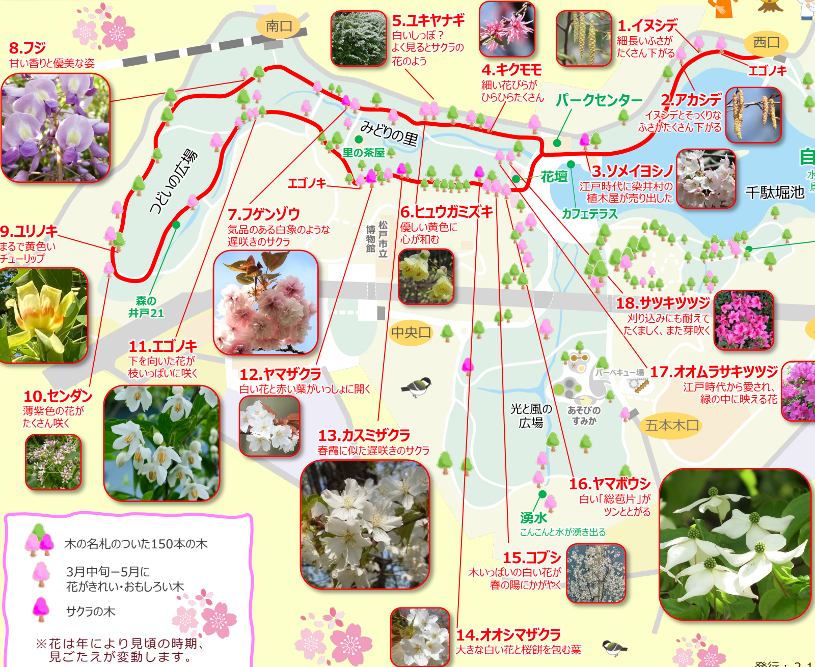
8.フジ 甘い香りと優美な姿