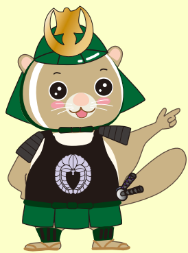
公園ゆるキャラ [武者さび君]