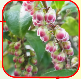
9.ヒサカキ 排気ガス、塩ラーメンなど 花の香りはどんなかんじ?