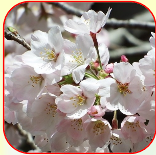
14.ソメイヨシノ 江戸時代に染井村の植木屋が売り出した