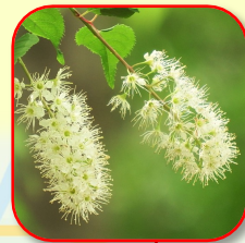
13.ウミズザクラ 木いっぱい白いシippo 通好みのサクラ