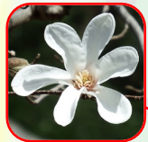
1.コブシ 早春に咲く白い花は ヒヨドリにならわれる