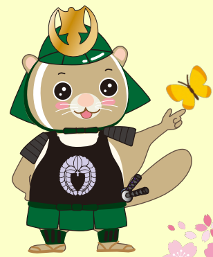
公園ゆるキャラ [武者さび君]