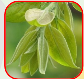
15.カキノキ 明るい黄緑色で やわらかく美味しそうな新葉