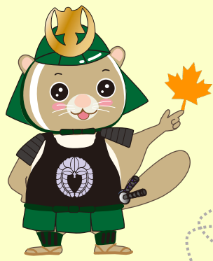
公園ゆるキャラ [武者さび君]