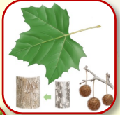
アメリカズカケノキ 大きば掌のような葉と丸い実が特徴