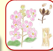
サルスベリ カールした花びらで2種類の雄しべがある面白い花