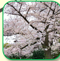
サクラ並木 春は満開の桜が見事