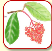
シマサルスベリ 奄美諸島や沖縄の離島に自生する木