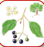
クスノキ 横に大きく枝を広げた雄大な姿