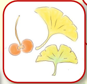
イチョウ 秋の黄葉が見事！ギンナンが沢山実る