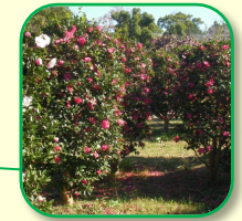
サザンカ山 冬に様々な品種が咲きほこる