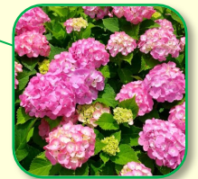
アジサイロード 西洋アジサイやガクアジサイが道の両側に