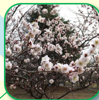
ウメ林 春一番に花が咲く