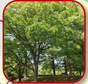
ケヤキ 公園の入り口のケヤキ、堂々とした立ち姿。