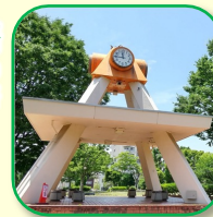
時計塔 亀戸中央公園のシンボルの時計塔