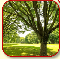
メタセコイア並木 外国の公園のような並木