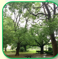
クスノキの林 一本一本ちがう個性的な樹の形