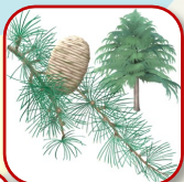
ヒマラヤスギ 背の高い木。秋の実がクリスマスローズと言われる