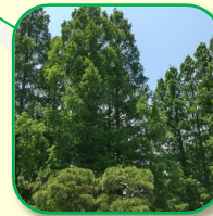
メタセコイア並木 梢が空に突き出すように伸びる木々