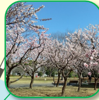
アンズ林 都内の公園ではめずらしい