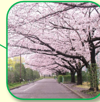
サクラ並木 広場をぐるりと囲む桜並木