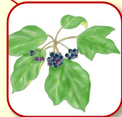
カクレミノ 色んな形の葉っぱが面白い