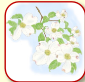
ハナミズキ 春の花、秋に真っ赤な実が美しい