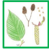
オオバヤシャブシ #56371