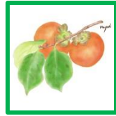
カキノキ #60648 #60652