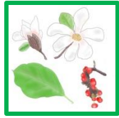
コブシ #60636 #60646