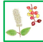
ウワミズザクラ #56378 #60624