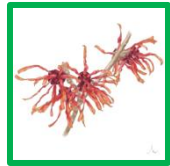
アカバナマンサク #74369