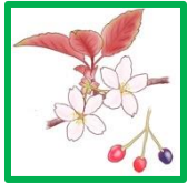
ヤマザクラ #56372 #60630