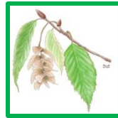
イヌシデ #56376 #60629 #60632