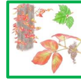
ツタウルシ #60627 #60637