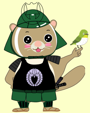
公園ゆるキャラ [武者さび君]