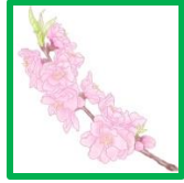
ハナモモ #56386 #60621 #60650