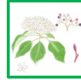
ミズキ #60625 #56373