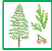
サワラ #56375 #56383