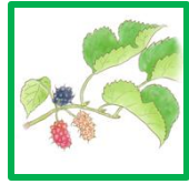
クワ #56389 #60647