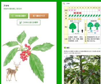
木や生き物の紹介

楽しい木の自己紹介やスポットの音声ガイド、クイズが現地の樹名板のQRコードから利用できます。