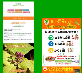
パーククエスト（クイズラリー）

季節ごとのテーマに合わせたクイズラリーを簡単に企画・開催でき来園者に楽しみながら学べる機会を提供します。